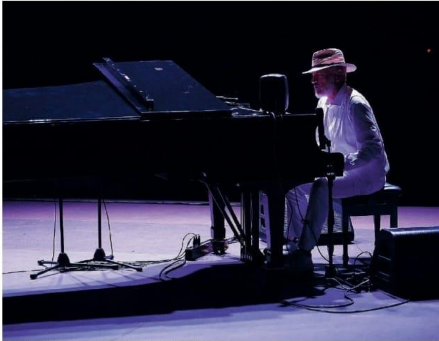
Sul palco Danilo Rea è uno più celebri pianisti europei

“La Grande Opera in Jazz” approda all’arena Alberto Neri